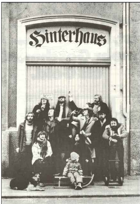
Programmheft aus 1978: Das HinterHaus und seine Macher.